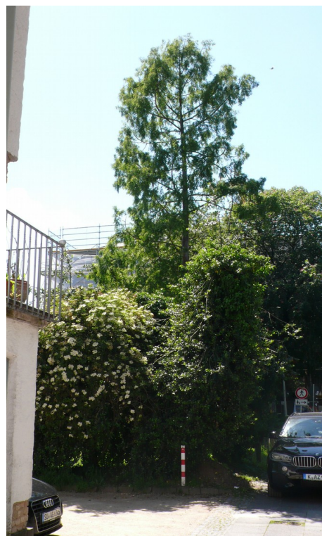
Abb. 1: Urweltmammutbaum am Lennéschen Geburtshaus (links). Versperrung der Sicht durch Wildwuchs

Was diesem Denkmal fehlt, ist eine Beschreibungstafel. Außerdem könnte die Sicht auf den Mammutbaum durch Entfernen von Wildwuchs wesentlich verbessert werden. Die Lenné-Gesellschaft Bonn e. V. wird sich dafür einsetzen, dass Passanten bald mehr von diesem Relikt aus der Urwelt sehen können.