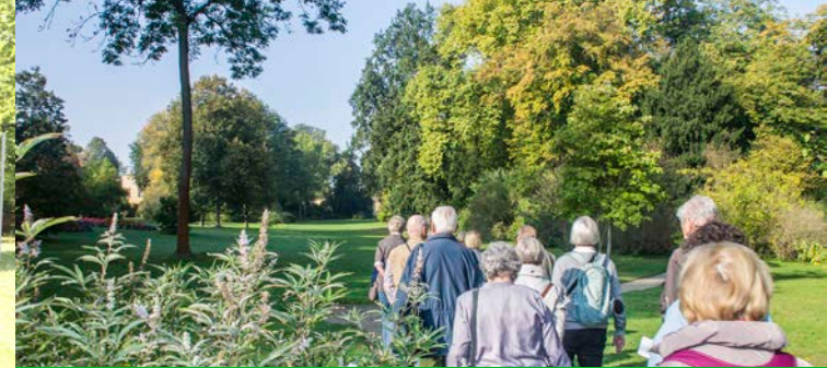
Der Potsdam-Club Bonn in dem nach Plänen von Lenné gestalteten Marlygarten