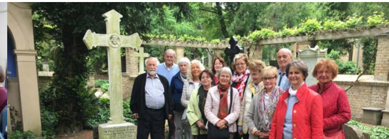
Die Lenné-Gesellschaft Bonn am Grab des Gartenkünstlers in Potsdam-Bornstedt