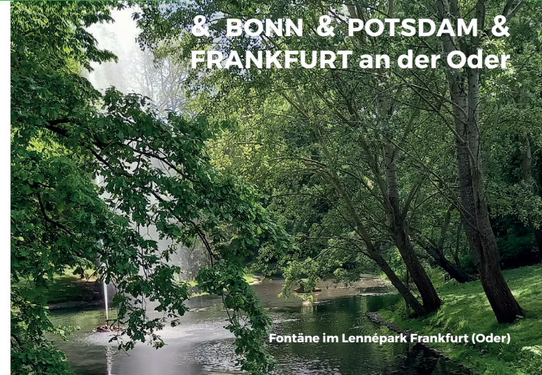
Fontäne im Lennépark Frankfurt (Oder)

& BONN & POTSDAM & FRANKFURT an der Oder