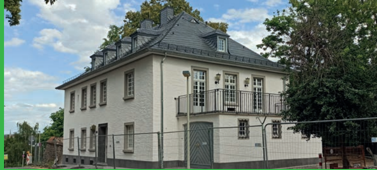
Geburtsaus von Peter Joseph Lenné im aktuellen Sanierungszustand