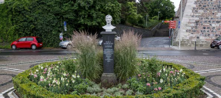
Das Lennéparterre am Rheinufer in Nähe seines Geburtshauses