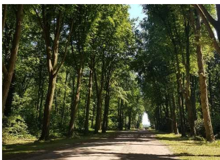
Sanierungsbedürftige Allee im Schlosspark Brühl