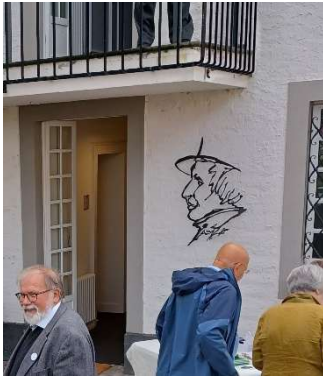
Neues Lenné-Relief von Marco Di Piazza

Die Universität hat die Anbringung des Portraits am vorgesehenen Ort im Blindfenster, der auch vom Denkmalschutz genehmigt war, abgelehnt. Wir hoffen, dass die Universität in weiteren Gesprächen einem neuen Platz neben dem Ausgang zur Terrasse an der Gartenseite zustimmen wird..