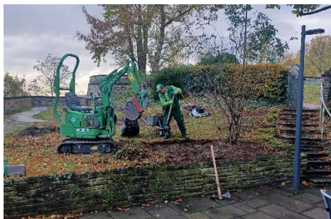
Arbeit Gartenbau Forster

Während der Bauarbeiten für die Rasentreppe tat sich plötzlich ein Bohrloch von 3,50 m Tiefe auf. Bei der Sanierung des Alten Zolls wurden 2015 Sondierungsbohrungen durchgeführt, dabei hat man vergessen, das Loch zu verfüllen. Der Bau- und Liegenschaftsbetrieb BLB hat uns jetzt die Verfüllung des Lochs zugesagt, so dass auch die Treppe fertiggestellt werden kann.