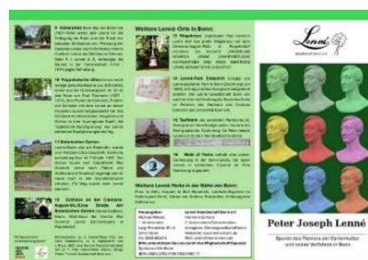
Flyer Lenné Rundgang

Da die Reserven aufgebraucht waren, haben wir uns entschlossen neue Flyer zu erstellen. Dadurch sollen neue Mitglieder geworben werden und unsere Gesellschaft besser dargestellt werden. Damit wir auch die UN-Mitarbeiter und ausländischen Gäste ansprechen können ist auch eine Version in englischer Sprache geplant.