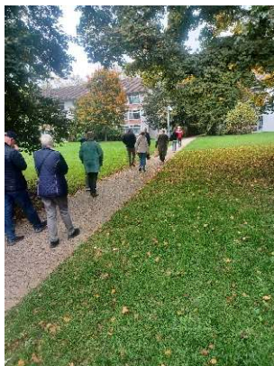
Amerikanische Siedlung Plittersdorf

Die grüne Tour 4 Klein-Amerika am Rhein am 5. Juli musste abgesagt werden. Sie wurde am 12. Oktober nachgeholt. Leider war hier nur eine geringe Beteiligung zu verzeichnen. Der Rundgang durch die Siedlung war sehr interessant. Der Gästeführer von Stattreisen hat uns bei der Führung auch die Gartenanlagen und das Haus Carstanjen gezeigt. Es war wirklich ein Klein-Amerika mit der Stimson Memorial Chapel, die am Sonntag gut besucht war. Bill Clinton schenkte sie 1990 der Stadt Bonn. Auch eine Schule, Supermarkt, Club, und eigene Energieversorgung waren vorhanden. Zum Glück konnte man verhindern, dass die großzügige Gartenanlage mit weiteren Wohnblöcken zugebaut wurde. Der Amerikanische Club wartet immer noch auf eine Renovierung und sinnvolle Nutzung.