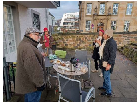
Nach getaner Arbeit