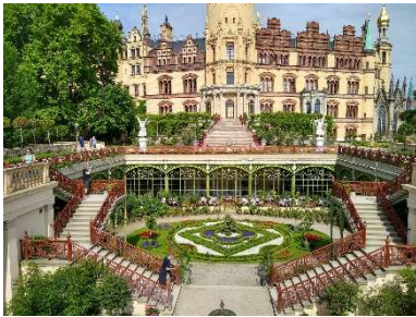
Schloss Schwerin mit Orangerie

einen außergewöhnlichen Wert für die gesamte Weltgemeinschaft haben, um sie auch für zukünftige Generationen zu bewahren. In Schwerin ist es nicht allein das schöne Schloss mit der Adresse Lennéstr. 1, sondern auch die Gartenanlagen von Lenné, der Dom und weitere insgesamt 30 Gebäude. Prof. Hammerschmidt ging auch auf die Anlagen in Ludwigslust ein, denn Ludwigslust war bis 1837 Residenz der Herzöge von Mecklenburg-Schwerin.