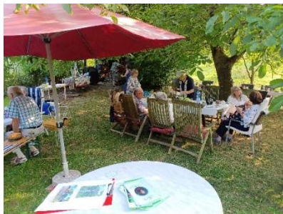
Sommerfest im Garten Wenzel

Auch diesmal war das Wetter am 9. August wieder gut und über 30 Personen sind der Einladung des 1. Vorsitzenden zum Sommerfest gefolgt. Nach einer Begrüßung mit Sekt konnten wir bei Kaffee und Kuchen unter dem Walnussbaum frohe Stunden genießen. Die Gäste zeigten sich sehr spendierfreudig, so dass wir für den Garten am Lenné-Haus 300 € verbuchen konnten.