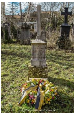
Grabmal F. L. v. Sckell