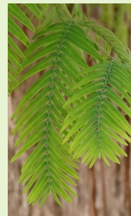
Zweig vom Urweltmammutbaum neben dem Lenné-Haus