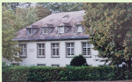
Geburtshaus Konviktstraße 4, Bonn

Nach einer Gartenlehre in Brühl, Studium und Tätigkeiten u.a. in Paris, Wien und Koblenz sowie schließlich in Potsdam, wurde Lenné einer der bedeutendsten Gartenkünstler und Landschaftsarchitekten des 19. Jahrhunderts in Deutschland.